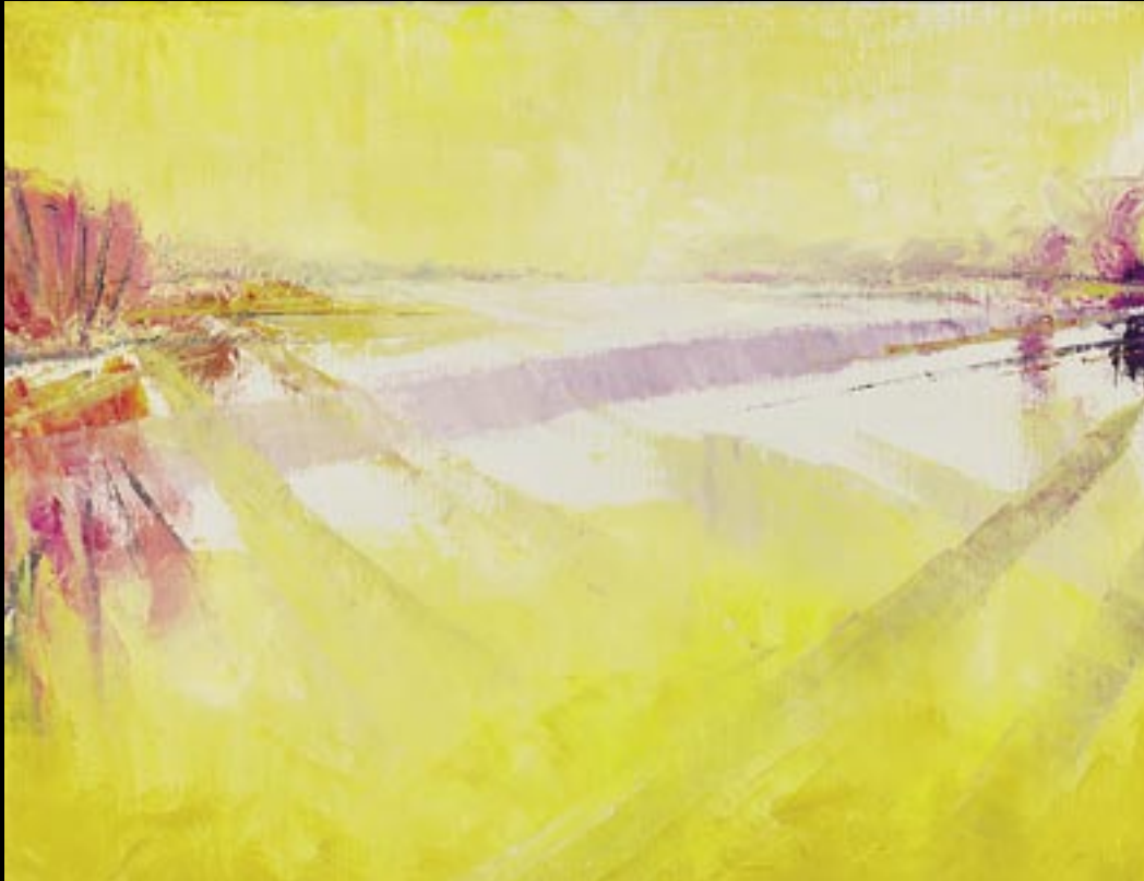
LUMIÈRE SUR LOIRE 02 Huile sur toile 40 x 60 cm Réalisée en : 2002