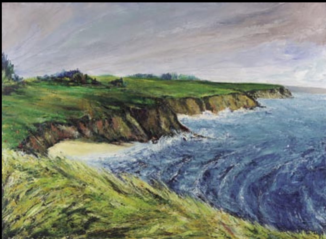
DU COTÉ DE BREST... Huile sur toile 50 x 80 cm Réalisée en : 1998