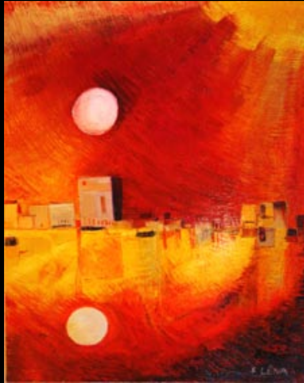
RÉSONANCE 01 Huile sur toile 80 x 100 cm Réalisée en : 2007