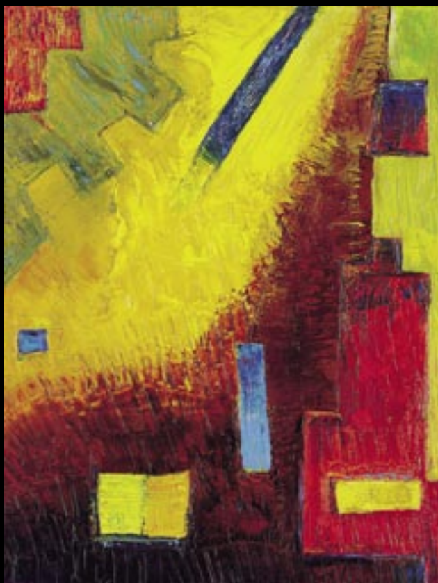
MATIÈRE À DIRE 01 Huile sur toile 50 x 65 cm Réalisée en : 2005