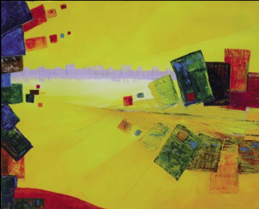
LOIRE EN MATIÈRE 01 Huile sur toile 50 x 70 cm Réalisée en : 2005