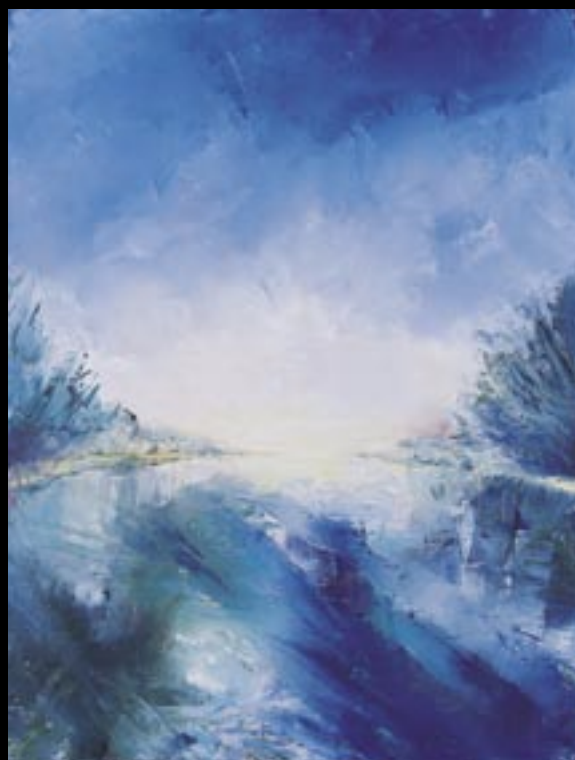
Lumière sur Loire 01