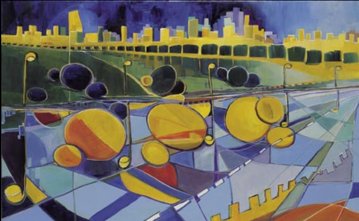
RYTHME GRAPHIQUE 01 Huile sur toile 81 x 130 cm Réalisée en : 2004