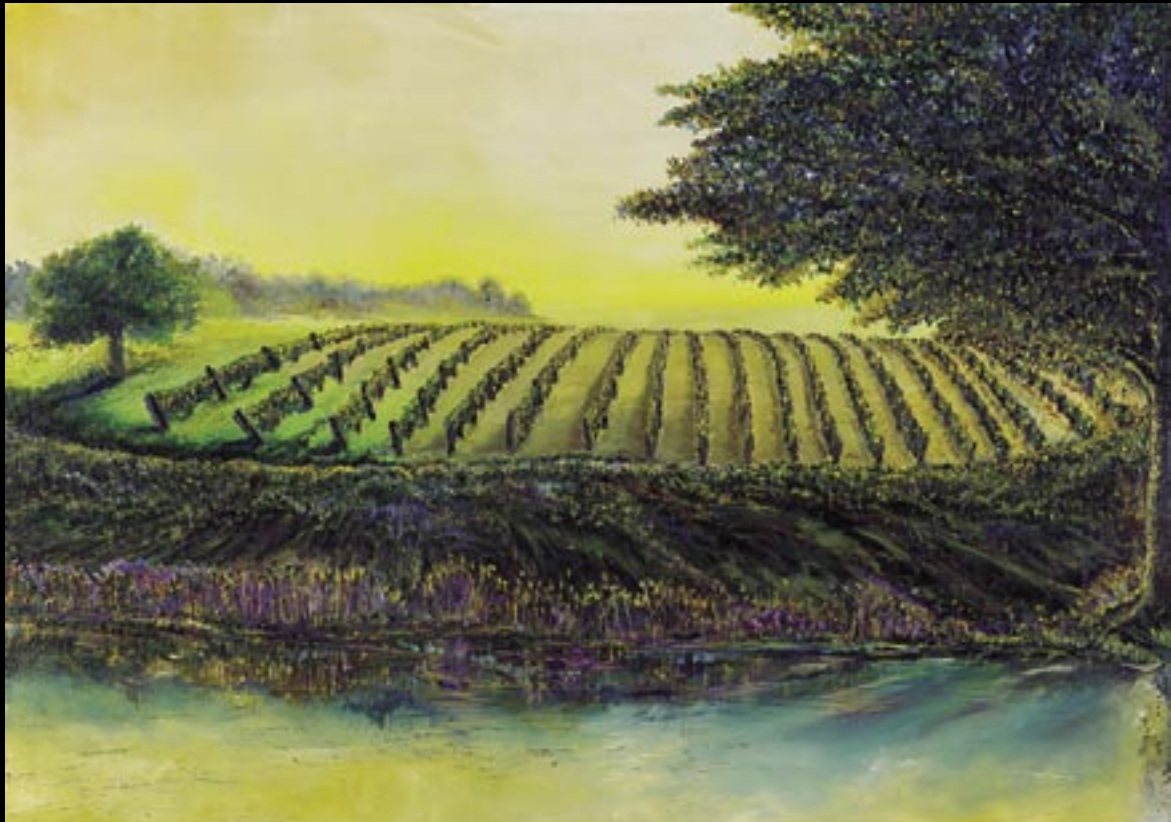
LES VIGNES... Huile sur toile 50 x 70 cm Réalisée en : 2000