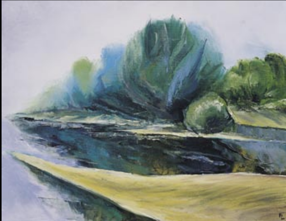
L'île... Huile sur toile 40 x 60 cm Réalisée en : 1994