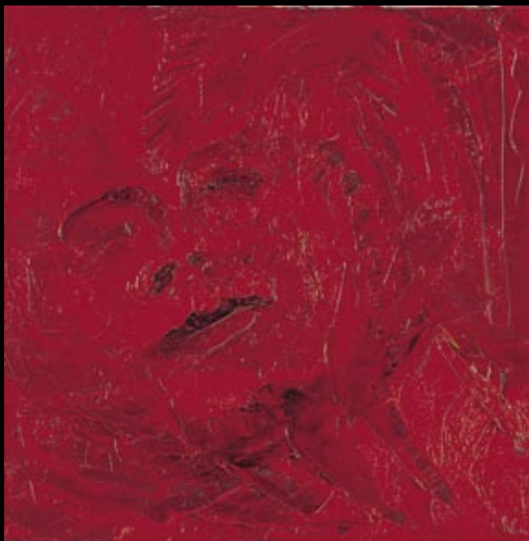
LES SENTIMENTS 01 Huile sur toile 50 x 50 cm Réalisée en : 1999