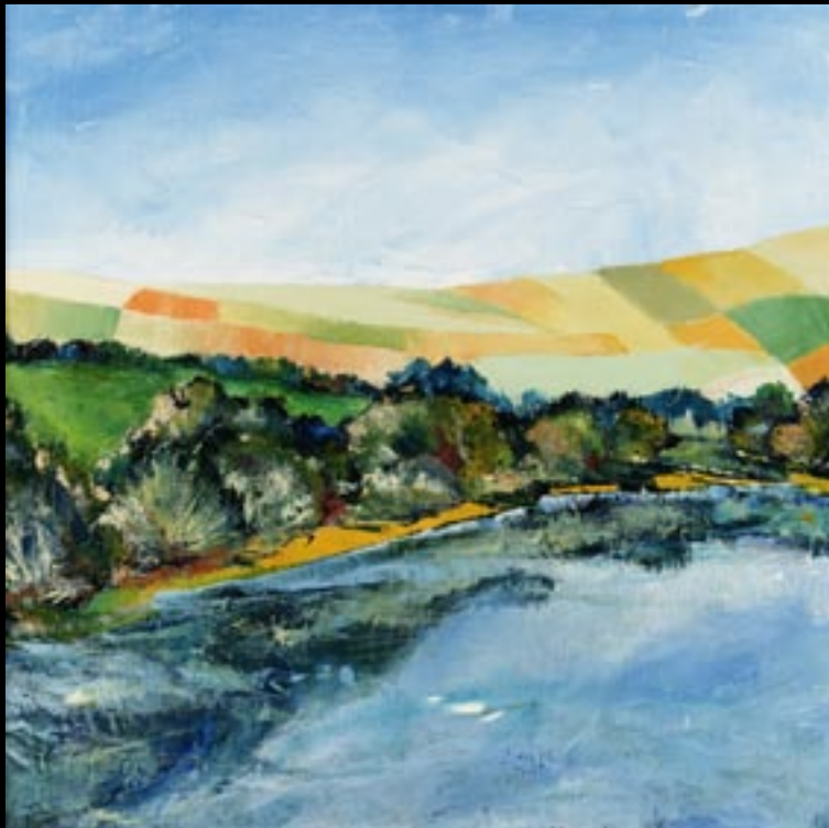
Pièce d'eau 01

Huile sur toile 60 x 60 cm Réalisée en : 1993